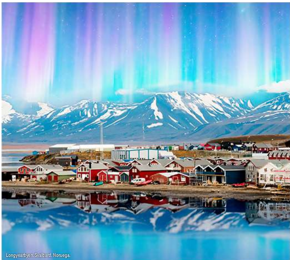
Longyearbyen, Svalbard, Noruega.

Desayuno. Por la mañana, ¡escápate de la rutina explorando las asombrosas cuevas de hielo a bordo de un Snowcat! Este vehículo te llevará al "Glaciar Longyear", al sur de la ciudad. Al descender en la cueva de hielo, entrarás en un mundo helado como nunca has visto. Verás plantas