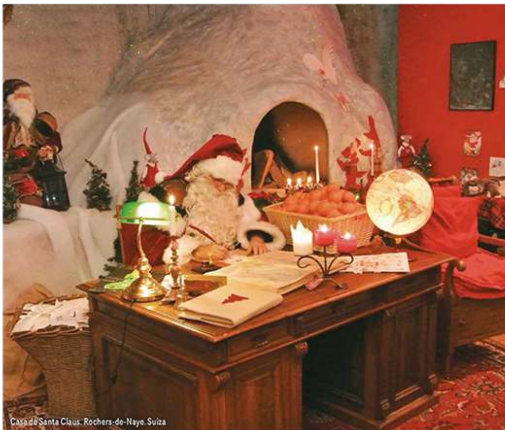
Casa de Santa Claus. Rochers-de-Naye. Suiza

Desayuno. Tiempo libre para visitar el Castillo de Chillón (entrada no incluida), accesible a pie, en autobús o en barco. Situado sobre una roca a orillas del lago de Ginebra, es uno de los monumentos históricos más visitados de Suiza. Durante siglos, este castillo ha sido fuente de inspiración para grandes escritores como Jean-Jacques Rousseau, Victor Hugo, Alejandro Dumas, Gustave Flaubert y Lord Byron. En época navideña, el castillo se transforma en un entorno mágico y encantador ideal para disfrutar en familia. Alojamiento.