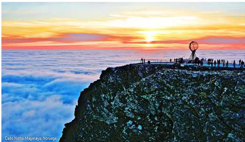
Cabo Norte, Magerøya, Noruega

Desayuno. Mañana libre en Alta. Recomendamos realizar el safari opcional en trineo de perros huskies, una experiencia inolvidable deslizándose por la nieve tirado por estos resistentes animales. Por la tarde, el grupo se dividirá en dos para disfrutar de actividades inolvidables: Visita al hotel de hielo y taller de escultura en hielo: Exploraremos las impresionantes instalaciones de un hotel construido enteramente con hielo y nieve, admirando sus sorprendentes esculturas. Posteriormente, participaremos en un taller de escultura en hielo guiado por un experto artesano, donde cada participante podrá tallar su propia figura. Al finalizar, brindaremos con una bebida en el bar de hielo.