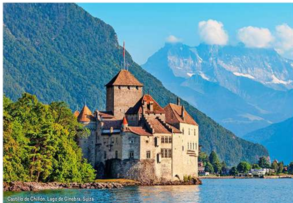
Castillo de Chillón. Lago de Ginebra. Suiza