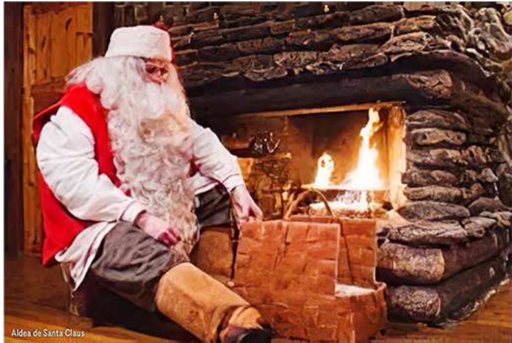
Aldea de Santa Claus